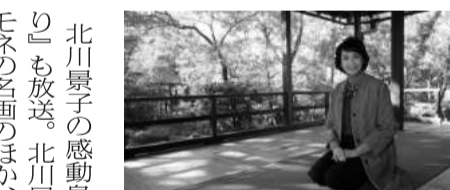
BS朝日4K「あなたの知らない京都旅〜1200年の物語〜」