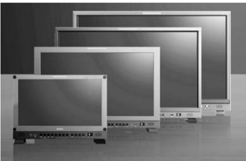
業務用液晶ディスプレイのラインアップ

「AM-3829」は、S、アナログインタフェースを搭載し、あらゆるシーンでの音声信号監視を実現する。「TR-5004」は、電源二重化対応のCX-