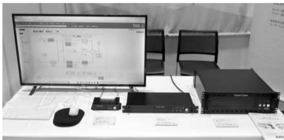
遠隔監視・制御システム

「Packet Caster」と「Packet Caster Terminal」は、送信所や中継局内にある機器・設備を、監視制御装置を介して一元監視し、異なるメーカーの機器情報も1つの画面で監視・制御