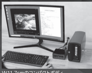
W11.7cmのコンパクトボディ