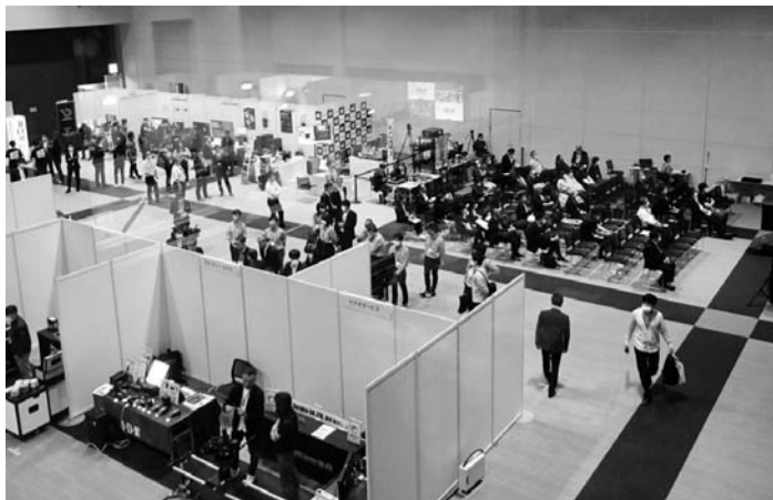
最新の機器・技術が一堂に集結する (写真は昨年展示会の様子)

東北映像フェスティバルは、東北地区における最大規模の業界イベントとして、放送・通信関連の最先端機器・技術や映像コンテンツに関する最新情報に触れる機会となる。