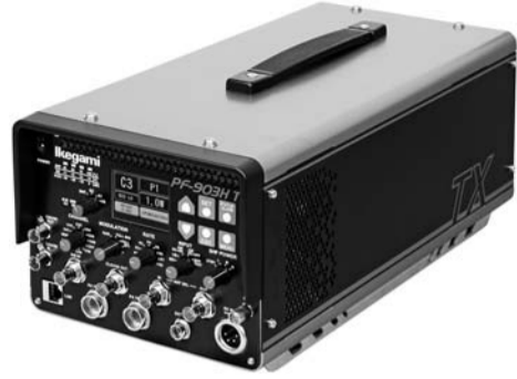
PF-903H (ヘリ搭載用モデル)

池上通信機は、『Technology Making Waves』技術のチカラで、あなたをしあわせに。』をテーマに展開する。最新のマルチバンド対応一体型FPU送信機「PF903」のほか、多彩な機能を有する60シリーズ液晶モニター「HLM-24800WR」と24型液晶モニター「HLM-1860WR」など、AVシステム機器やIPシステムもそろえる。